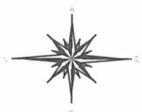
Схема планировочной организации земельного участка