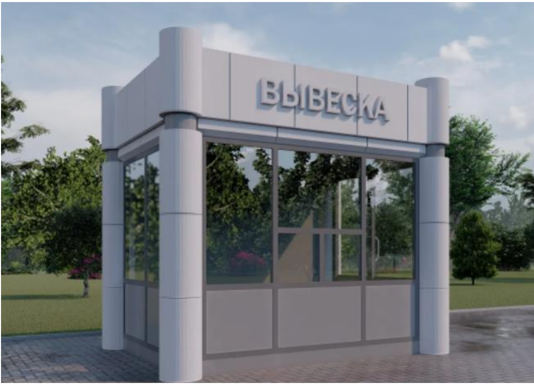
Тип «Современный» С9