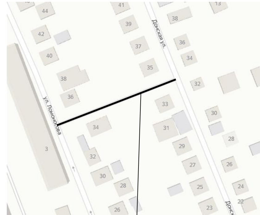
Место расположения проезда