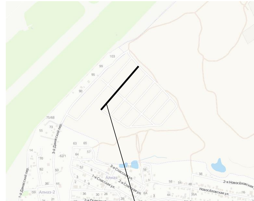
Место расположения улицы