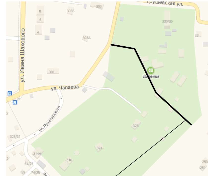
Место расположения улицы